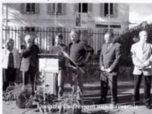
Le lâcher de pigeons