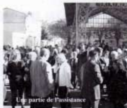
Une partie de l'assistance