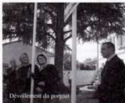
Dévoilement du portrait

Samedi 22 octobre, plus de 300 personnes attendaient devant la Mairie, pour ce que Monsieur le Maire qualifiera en souhaitant la bienvenue à tous, " d'un moment pas comme les autres ", qui marque la vie d'un village et qui fait que chacun de ses habitants devient le temps d'un instant et peut-être pour toujours " un citoyen du Monde ".