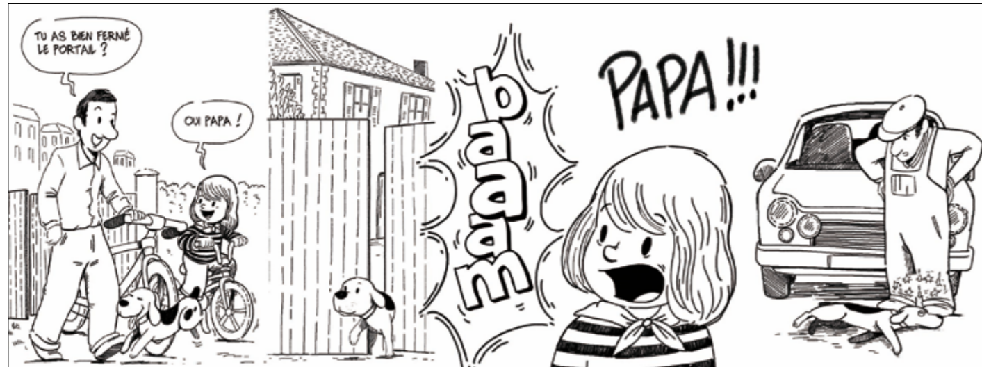
Dessin : Sandrine REVEL. Scénaristes : Albert

SENSIBILISER EN IMAGES SUR LE PROBLÈME DES CHIENS ERRANTS