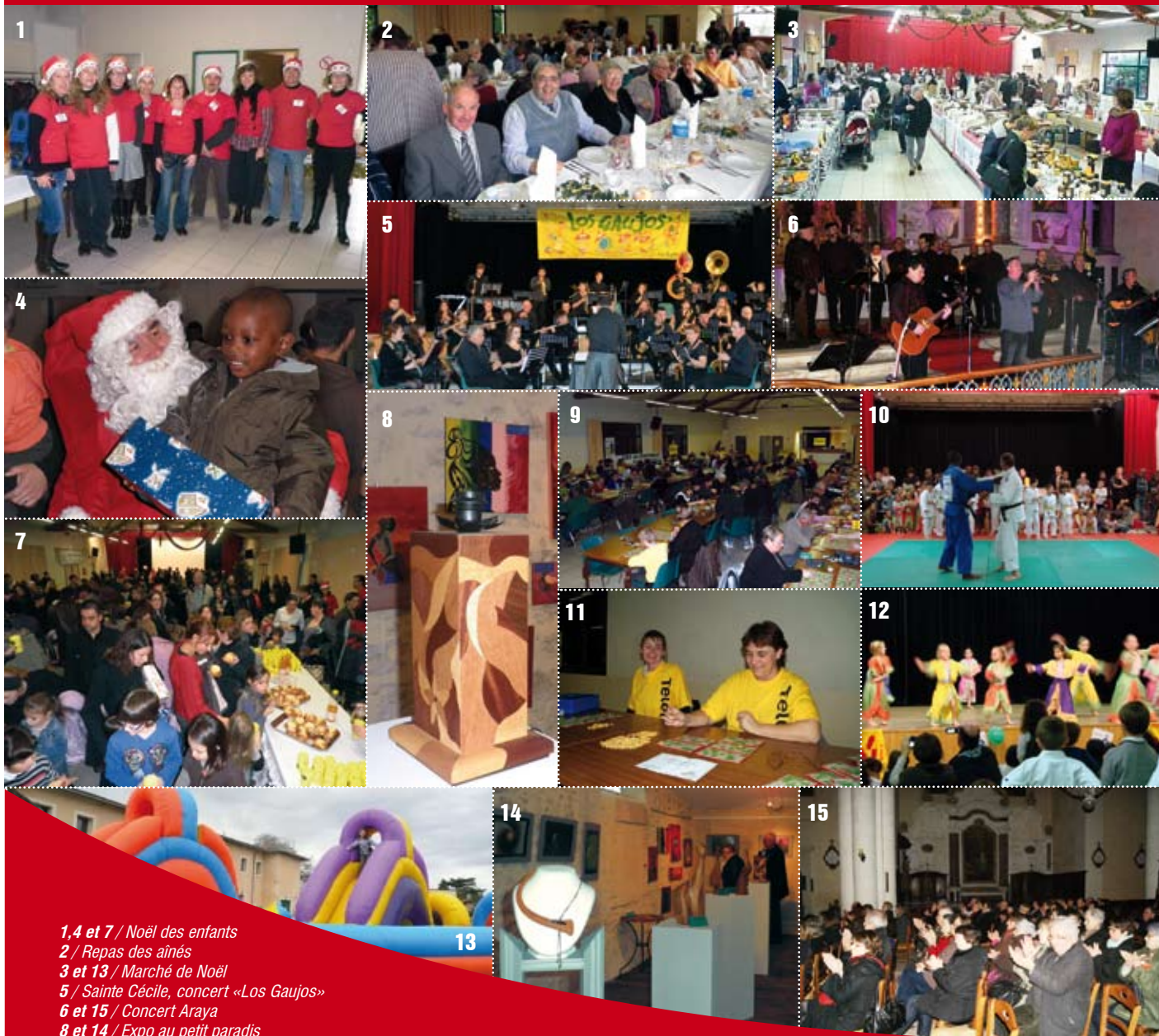
1, 4 et 7 / Noël des enfants 2 / Repas des aînés 3 et 13 / Marché de Noël 5 / Sainte Cécile, concert «Los Gaujos» 6 et 15 / Concert Araya 8 et 14 / Expo au petit paradis 9, 10, 11 et 12 / Téléthon