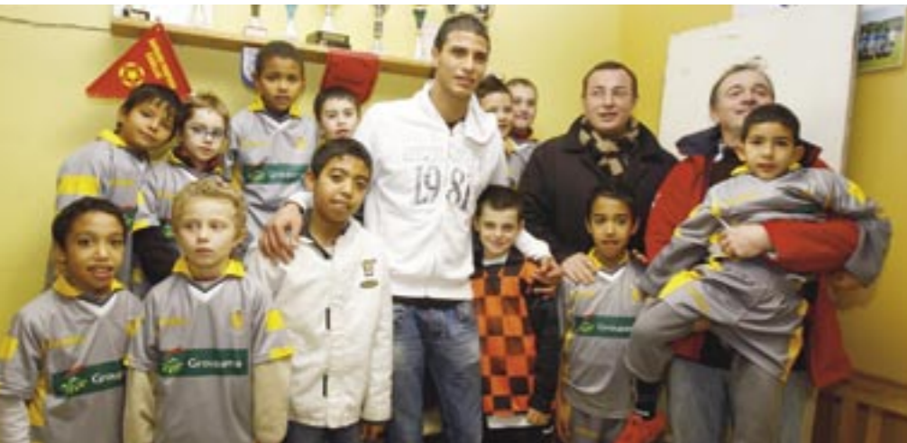
Vidéo et diaporama en ligne sur www.barsac.fr

Evènement ! Marouane Chamakh, l'attaquant des Girondins de Bordeaux est venu rendre une visite surprise aux petits joueurs du Football Club Barsac - Preignac 02. Un bien beau cadeau de Noël, avant l'heure, pour tous.