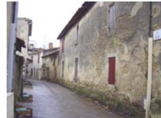
La ruelle qui, jusqu'au milieu du 19 e siècle était la Route royale de Bordeaux à Bayonne, malgré son étroitesse. A droite dans l'angle, l'ancienne maison de la famille Roborel 17 e me siècle qui a exercé des charges prévotales importantes à Barsac jusqu'à la Révolution, avant de racheter la propriété qui est le Château Climens.

Certains propriétaires de maisons de la Grand'Rue et en dehors, même à la campagne, ont « placé des grandes pierres