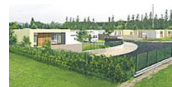
Esquisse d'un projet d'aire d'accueil

Toutes les dates des réunions, de l'enquête publique, des permanences et de manière générale toutes les informations relatives à cette procédure seront diffusées dans tous les supports de communication de la commune (site internet, newsletter, journal municipal, panneaux lumineux, etc.).