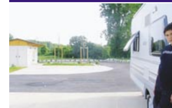
Accueil réglementé au sein d'une aire

Réunion publique du 11 septembre 2009 19h — Salle Bastard