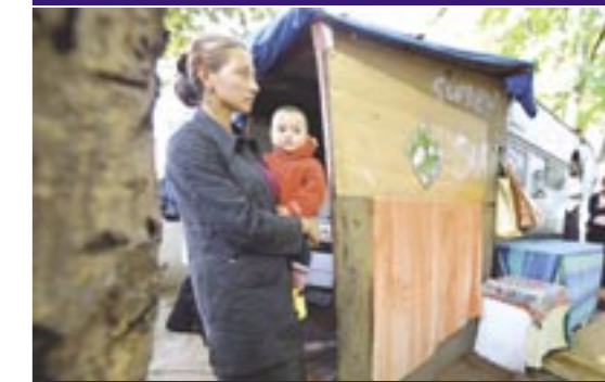
Installation actuelle sans aire d'accueil