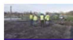
La future station d'épuration et un exemple de station avec étendue de roseaux.