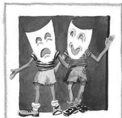
LE P'TIT ATELIER

" Le P'tit Atelier " démarre une nouvelle saison et accueille les enfants à partir de 6 ans le mercredi. La durée des ateliers varie en fonction des âges : 1h30 pour les plus jeunes, 2 heures pour les autres. Les cotisations mensuelles sont de 20 et 25 € en fonction de la durée de l'atelier. L'adhésion annuelle est de 15 €. L'atelier est animé par Virginie LABBE-FRANCESCHINIS. Pour toute information : Virginie LABBE-FRANCESCHINIS au 05 57 31 05 75 et 06 82 59 63 64 niedepie@hotmail.fr