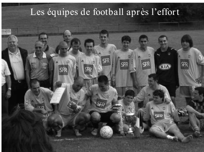
Les équipes de football après l'effort

De l'avis général et du plus jeune (16 ans) au plus âgé (81 ans), ce séjour fut une grande réussite, ce qui expliqua peut-être les mines tristes le 15 juillet au matin lorsqu'il fallut prendre le bus pour rentrer à la maison. Mais chacun a d'ores et déjà à l'esprit la venue de nos amis d'outre Rhin du 11 au 15 juillet 2009.