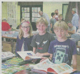
Les jeunes bédéphiles ont fait leur choix avant les dédicaces