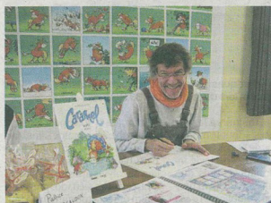
Le petit cheval « Caramel », de Patrice Marsaudon, s'adressait aux plus jeunes lecteurs