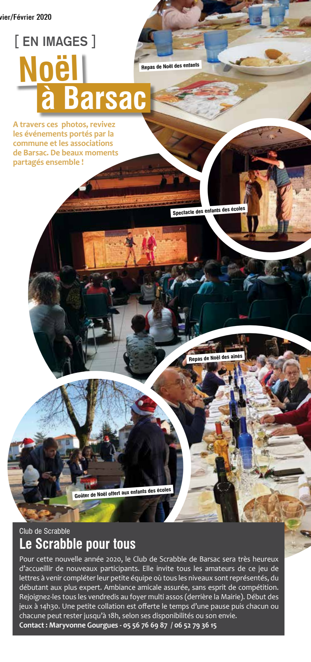
Repas de Noël des enfants

A travers ces photos, revivez les événements portés par la commune et les associations de Barsac. De beaux moments partagés ensemble !