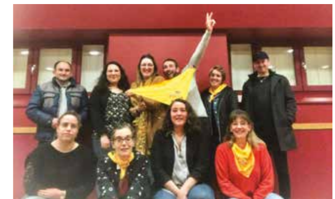
JUMELAGE BARSAC SAINT-CERNIN