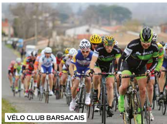
VÉLO CLUB BARSACAIS

Contact : 06 30 99 06 19 ou 05 57 98 47 75