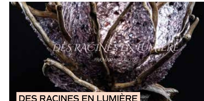
DES RACINES EN LUMIÈRE

Prendre rendez-vous au 06 50 97 16 81 ou sur la plateforme de réservation www.fresha.com/fr