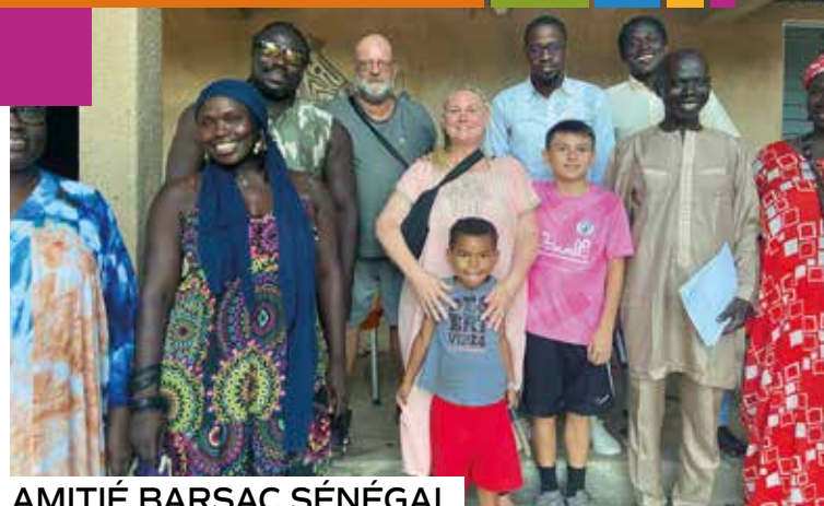
AMITIÉ BARSAC SÉNÉGAL